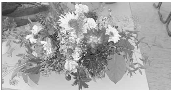
Blumengesteck – im Unterricht selbst hergestellt

Wir bitten alle Verkehrsteilnehmerinnen und Verkehrsteilnehmer um Verständnis für die entstehenden Einschränkungen.